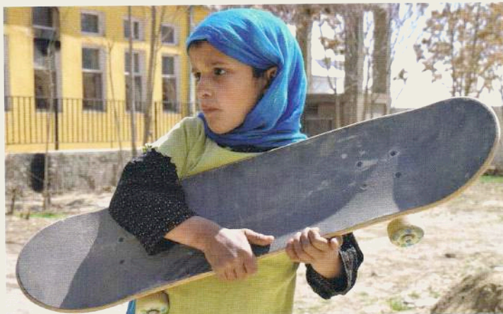
Idrottsanläggningen Skateistan i Kabul, ger såväl flickor som pojkar från olika etniska grupper, möjligheter att åka skateboard tillsammans. Filmen Skateistan visades på Kiasma under årets URB-festival.

krigsskadade staden för tusentals barn, och själva sporten utövas tillsammans med andra utbildningsprogram och ger nytt hopp för många barn i mångmiljonstaden Kabul.