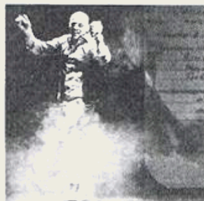
LEBENSTANZ: Storm gastierte im Ballhof Zwei.

der, der Kleinstadt, vom ersten Breakdance-Boom, der ihn nach oben spülte, vom Auf-